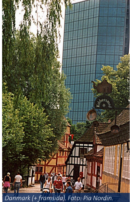
Danmark (+ framsida).