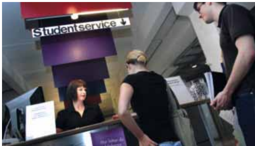
Antalet sökande var fler men vid terminsstarten fanns ändå många lediga platser.

TEXT: MARIA ERLANDSSON