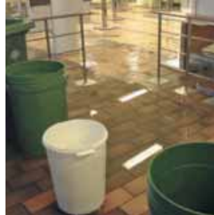
Cirka 60 kubikmeter vatten rann ut.

– Liknande skadegörelse riskerar att inträffa igen tills dess gärningsmannen grips.