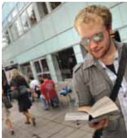
Närmare 100 masterprogram fanns att söka till hösten, varav en tredjedel engelskspråkiga.