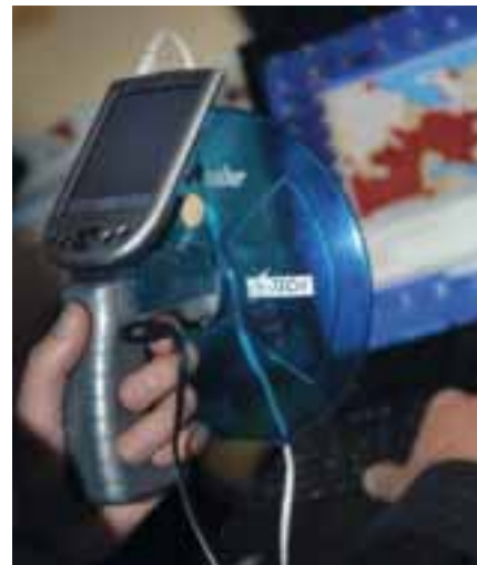
Med Backseat Playground går det att skapa ett spel utifrån omgivningen man passerar.

Centret finns vid Institutionen för data- och systemvetenskap, Stockholms universitet inom Campus IT-universitetet i Kista. Verksamheten bedrivs i samarbete med de svenska IT-instituten SICS och