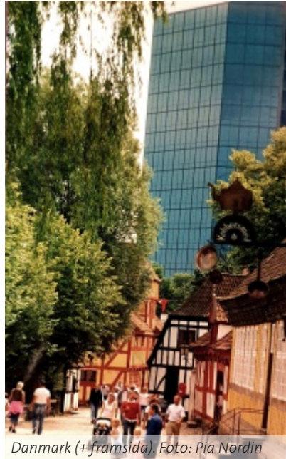
Danmark (+framsida).