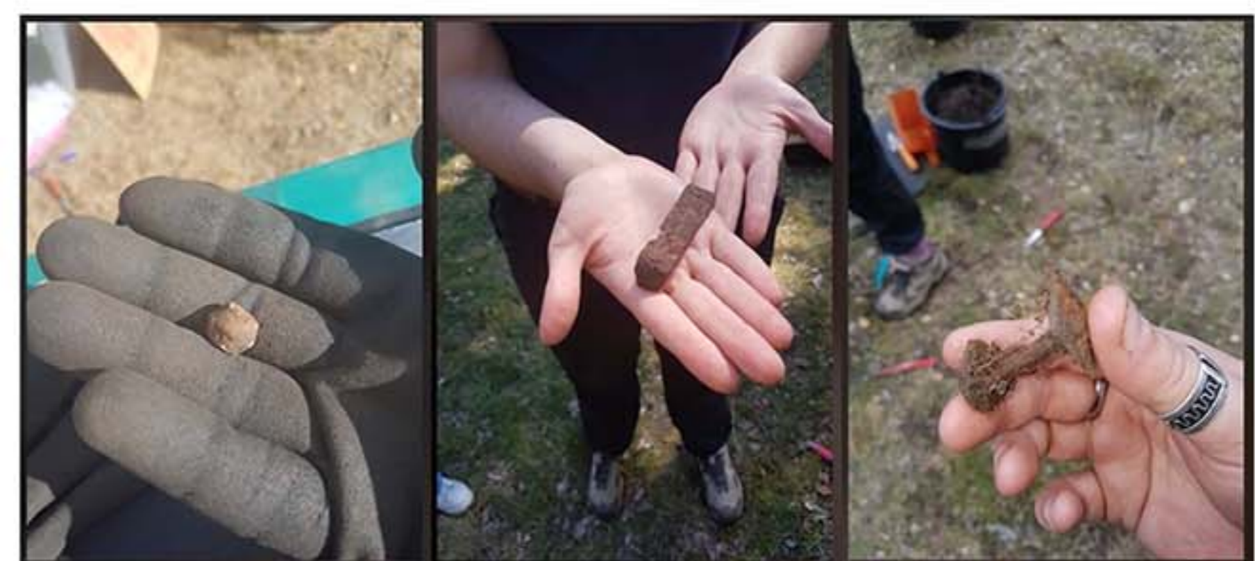
Fig. 3. Fynd från utgrävningen i Kugghamn 2020, viktlod, skavjärn, båtnit.

Den övervägande delen av fyndmaterialet från utgrävningen 2020 har delats in i fem kategorier, nitar, nitbrickor, järnfragment, brynen och ben. De utgör tillsammans 75 % av fyndmaterialet. Fynden uppvisar en specifik sammansättning som kan jämföras med Adelsö och Paviken med tydliga spår efter hantverk. Brynen har använts för att hålla eggarna på verktygen skarpa och de stora antalet fragmenterade nitar med tillhörande brickor tyder snarast på reparation av båtar än av båtbyggeri. Genom att undersöka fyndsammansättningarna från de utvalda platserna och hur de har tolkats och jämföra det mot fyndmaterialet från Kugghamn ger det mig bra indikationer kring vilka typer av aktiviteter som kan ha utförts på platsen. Det finns tydliga likheter från varvsverksamheten i Paviken vilket leder mig att tolka denna plats som en plats för reparation av båtar till skillnad från Pavikens tillverkning av båtar.