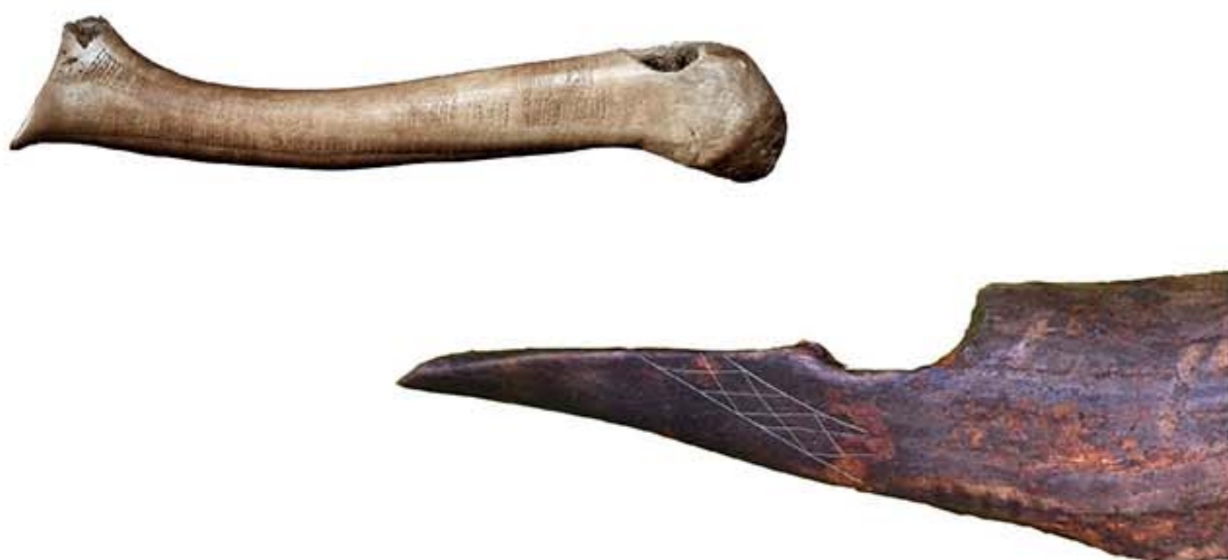
Två av studiens nio föremål. Överst: Hornskaftet från Tågerup. Nederst: Hornhacka från Kanaljorden, Motala.

Genom att studera nio mesolitiska ornerade föremål utifrån ett ny-animistiskt perspektiv visar studien att ornamentik har fungerat som en kommunikation gentemot den animerade omgivningen. Tidigare tolkningar av föremålen har framhåvt ornamentikens koppling till en rituell tillverkningsprocess samt deponering. Denna studie har dock visat att praktikerna att applicera ornamentiken samt deponeringen av föremålen ska förstås ut ett funktionellt perspektiv. Baserat på ett etnografiskt analogibruk har dessa funktionella praktiker utförts inom en animistisk ontologi vilket resulterar i att dualismen mellan de funktionella och rituella är meningslös i studiet av dessa föremål.