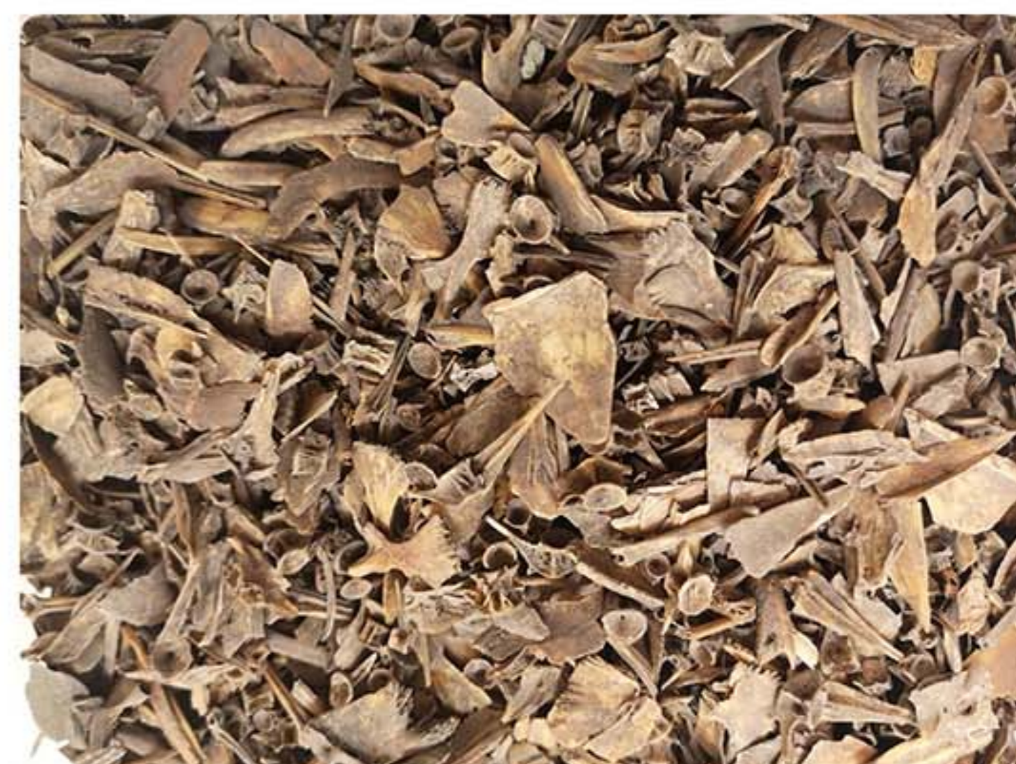
Figur 1. Inom stenåldersarkeologin har fiskben länge ignorerats och kunskapspotentialen underskattats

Fisken och fisket: För att förstå fisket vid Korsnäs är det kritiskt att beakta fiskens karaktär i relation till den lokala miljön och vattendragens karaktär, Figur 2. En undersökning av fiskarnas storlek ger viktiga inblickar i fisket. Resultaten antyder att man hade specifika strategier för fisket av olika arter, Figur 3.