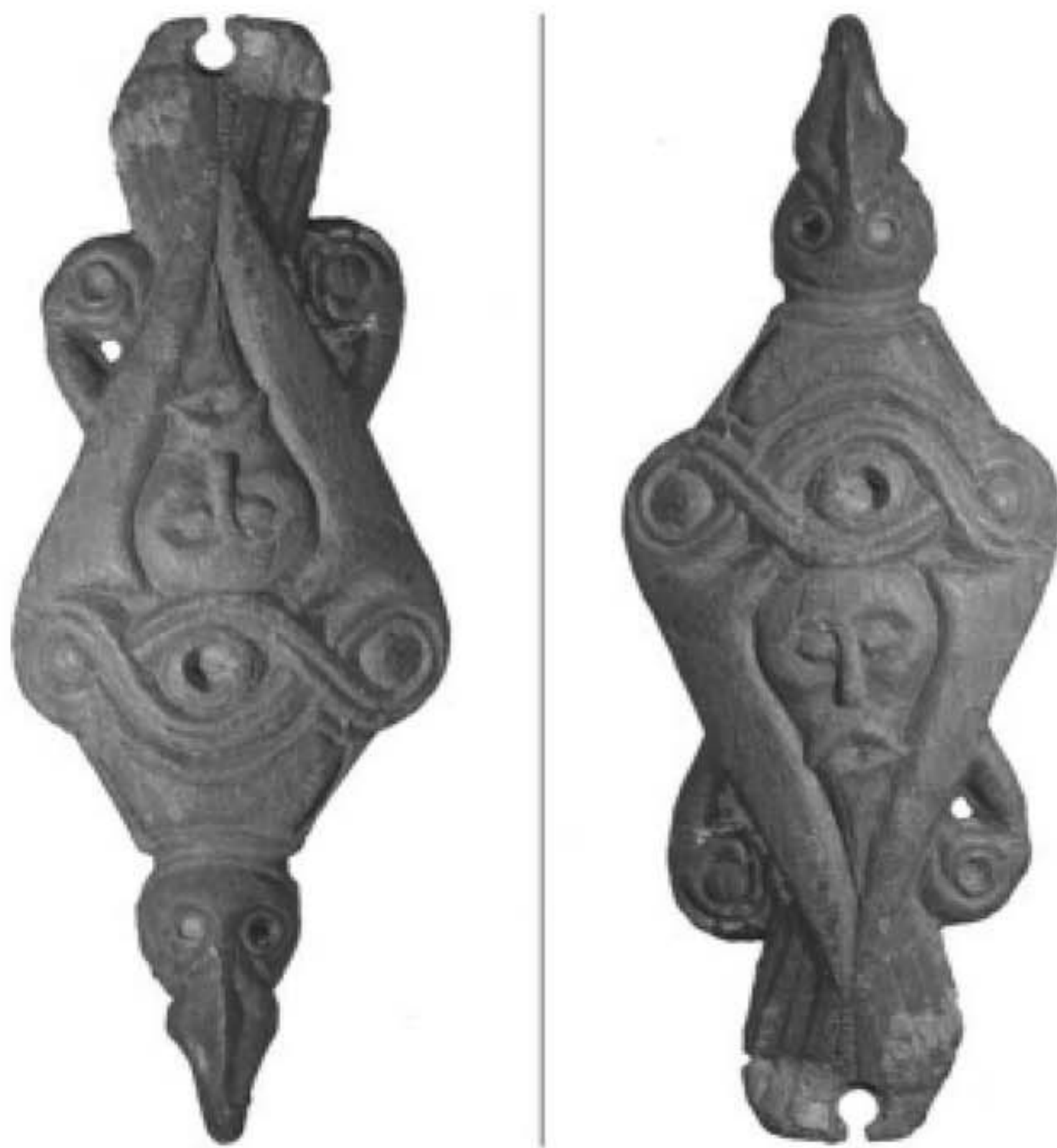
Fågelbrosch U263 från Uppåkra, Skåne.