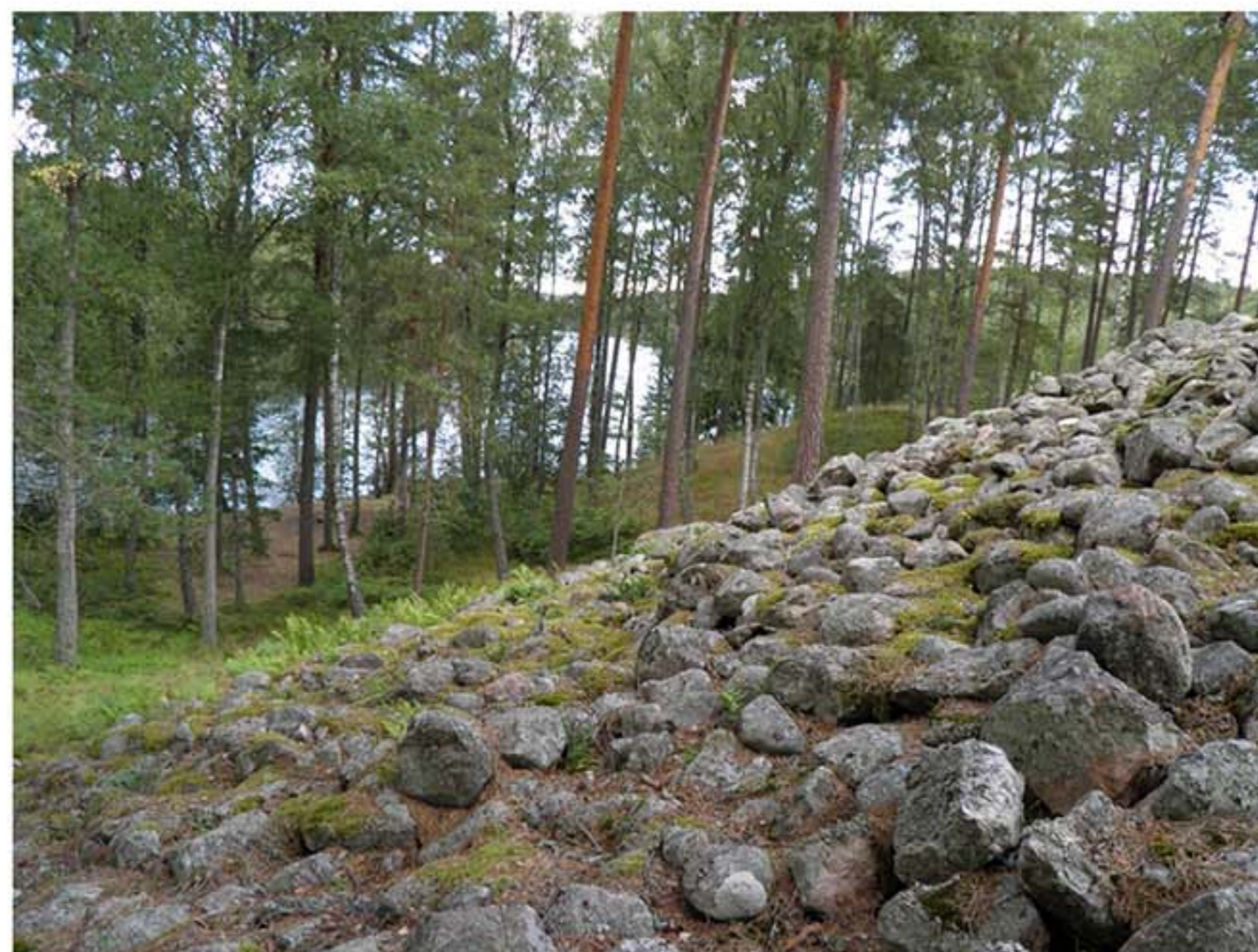
Utsikt över Marvikensjöarna från ringröset vid Laxne, Gåsinge-Dillnäs 8.

Hällristningar finns i skyddade vikar vid öst-västliga förbindelser. Här finns även skärvstenshögar och möjliga boplatser.