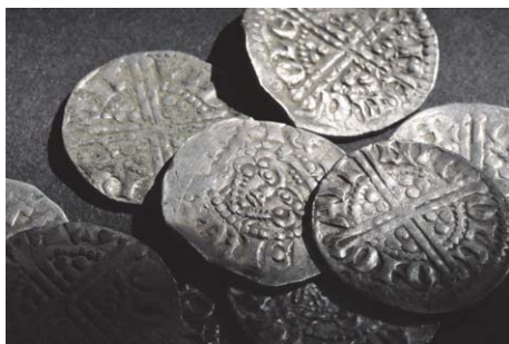
Fig. 2. Engelska pennies från Henrik III 1216-72 av Long Cross-typen.

De tidigare största medeltida skatterna från Skåne, Börringekloster och Kyrkoköpinge,