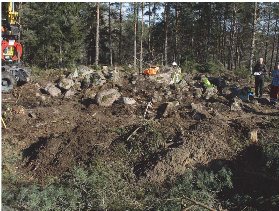
Fig. 1. Fyndplatsen med graven från förromersk järnålder.

Därför vidtog en rad telefonsamtal, chefer och länsstyrelse informerades, en arkeolog med särskild vana att arbeta med metalldetektor kallades ut. Eftermiddagen blev intensiv, med flera besökare, kontinuerligt grävande, dokumenterande och avsökande med detektor för att få upp alla mynt innan kvällen kom. Mynten vilade på ett större stenblock och låg väl samlade inom ett ca 10x30 cm stort område med inblandning av humus och rottrådar. De stora stenblocken och den lösa myllan innebar att mynten låg tämligen löst och inte kunde plockas upp som ett preparat. Några enstaka mynt hade letat