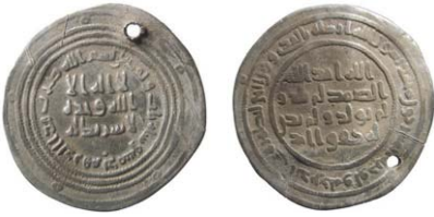
Fig. 6. Umayyad. Kalif Abd al-Malik . Dimashq 83 e.H./702/3 e.Kr. Dirhem.

stampkedjor. Imitationens frånsidesstamp är känd sedan tidigare och genom den kan myntet bestämmas som khazariskt med en tillverkningstid på 830-talet (troligen omkring år 837/838). Dess existens kan tas till intäkt för de kufiska eller islamiska myntens popularitet i början av 800-talet. Khazarerna, som vid den tiden var den enda staten i Östeuropa, insåg fördelarna med att tillverka egna mynt, som