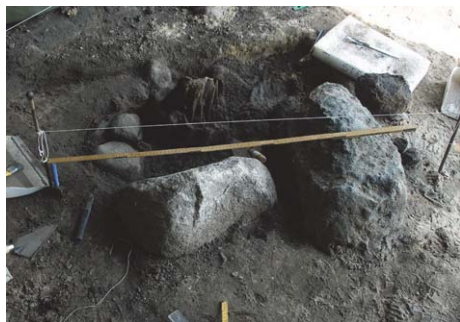
Fig. 3. Det bäst bevarade stolphålet (anl. 7 på planen fig. 2) som har stöttats av två stora och ett flertal mindre stenar. Träet är mycket välbevarat och är inlämnat för dendrodatering vilket gör att man kan fastställa exakt år när det fälldes, d.v.s när huset byggdes. Stolpen är bevarad till en längd av ca 40 cm.

Myntfynden i Klints visar på en områdeskontinuitet under mycket lång tid och de har hamnat i jorden vid fyra olika tillfällen. Det äldsta myntet är en barbarisk efterprägling av en romersk denar (fig. 4). Efterpräglingarna är relativt sett vanliga i gotländska fynd och det gjorde att man för länge sen trodde att en del av dem kunde vara präglade på Gotland. Lennart Lind kunde senare konstatera att de romerska mynten importerats från norra Polen, sannolikt på 300-talet, och efterpräglingarna