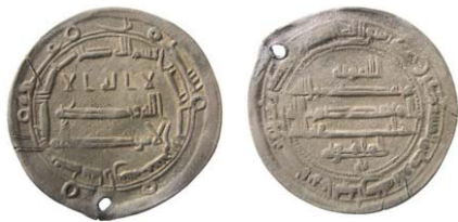
Fig. 9. Abbasid. Kalif al-Mu'tasim. Madinat Arran 220 e.H./835 e.Kr. Dirhem.