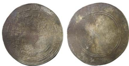
Fig. 10. Abbasid. Kalif al-Mu'tasim. Samarqand 220 e.H./835 e.Kr. Dirhem.