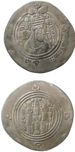
Fig. 8. Arabasasanid. Muhallab b. Abi Sufra. BYSh (Bishapur, nuvarande Iran) 76 e.H./695 e.Kr. Drachm.

Myntet i fig. 9 från Kaukasus uppvisar det sista årtalet bland de islamiska, inomkalifatiska mynten: 220 e.H. (835 e. Kr.). Myntorten är