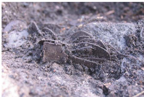
Fig. 3. I det översta skiktet kunde man fortfarande se att mynten en gång legat samlade, möjligen i staplar.

Skattens sammansättning framgår av tab. 1. Huvudintrycket är att det finns ovanligt många