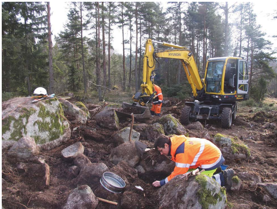
Fig. 2. Skatten hittades mellan några större stenar i utkanten av graven.

Skattfyndet lyfter fram en rad frågor att arbeta vidare med. Skattfyndet och dess sammansättning berättar om myntens resa till