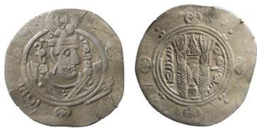
Fig. 5. Arabsasanid, Tabaristan 130 PYE/781 e.Kr. Halvdrachm.

Imitationen i Sundveda är särskilt intressant (fig. 7). De uppgifter om präglingsort och årtal som står på myntet ("Fredens stad 204", d.v.s. Bagdad 819/820) är hämtade från ett originalmynt med detta ursprung. Det riktiga ursprunget anges inte, men det är möjligt att sluta sig till vissa fakta genom s. k.