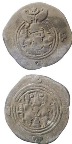
Fig. 4. Sasanidiska riket. Khusraw II 590/1-628. Drachm år 10 (600/1 e.Kr.).

Tab. 1. Skattens sammansättning. Siffrorna är preliminära.