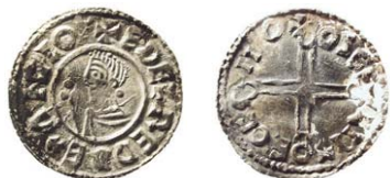
Fig. 6. Tidigare okänd stampkombination av skandinavisk efterprägling som visar en hybrid av Æthelred II:s Crux och Long Cross typer. Frånsidans inskrifter kopierar myntorten York och myntmästarnamnet Asketill (Oscetl).

De flesta mynt i skatter från denna tid har böjts i samband med att man testat silvret för att se att det inte hade en kärna av koppar. Normalt har man sen böjt tillbaka mynten så att de är relativt plana. Det har man inte gjort med mynten i skatten från Klints där man fortfarande kan notera att många av mynten är kraftigt böjda.