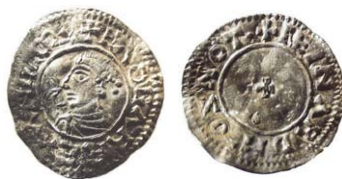
Fig. 5. England. Edgar 959-975. Reform Small Cross typ ca 973-975, Nottingham, myntmästare. Reinard. Nottingham var tidigare okänd som myntort för denna typ och Reinhard, som namnet kan normaliseras, är mycket ovanligt under denna tid.

I England fanns det i princip bara en myntherre, kungen. Övriga, bl.a. ärkebiskopen av York präglade enbart mynt i kungens namn och de kan inte skiljas från kungens mynt. De engelska mynten består av ett fåtal typer som var och en präglades (och var giltig) under