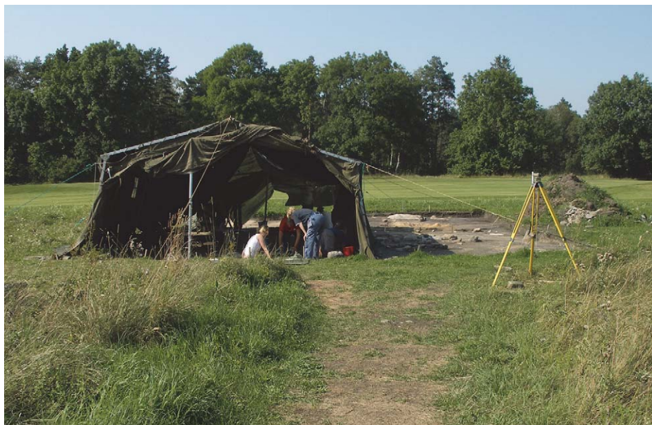
Fig. 1. Fyndplatsen under utgrävning. P.g.a. att den låg mycket nära ett av golfbanans hål var det nödvändigt att ha ett skydd mot golfbollar som hamnade vid sidan av greenen.

I ängs- och åkermarken väster om bebyggelsen finns ett flertal lämningar av järnålderns gårdar. Inte långt från platsen för den påträffade skatten finns ett stenblock