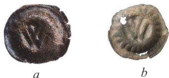
Fig. 2. Magnus Eriksson 1319-1363. Penning ca 1354-1363 med bokstaven W inom strålring. Fynd från Tavstehus (Hämeenlinna), Tavstland, Finland (a) resp. Västerås domkyrka, Västmanland (b). Nationalmuseum, Helsingfors, resp. Västmanlands Läns Museum, Västerås.

Hur kunde mynt från Viborg ha sett ut? Åbo (Aboa) och Västerås (Västra Aros) präglande mynt med A som kännetecken, och således kunde man tänka sig att Viborg skulle ha haft W på mynten, liksom i stadens sigill. 9 Från Magnus Erikssons (1319-1363) tid finns det en tvåsidig penning (präglad 1340-1354) med bokstaven W mellan tre kronor. Myntet (fig. 1), som är funnet i Bjärnä på Finlands