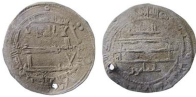
Fig. 7. Khazar, efterprägling av Abbasid, "Madinat al-Salam 104", daterbar till ca 223 e.H./837-38 e.Kr. (t.p.q. efter Devitsafyndet i Ryssland; ζnns även i Vyzhighshafyndet, t.p.q. 227 e.H.).

Mazandaran). Då var abbasiderna herrar i Bagdad, men måste tillåta denna icke-islamiska myntning i norr (fig. 5). Åtsidan uppvisar en bild av en storkonung från förr, här utan namnet på vederbörande abbasidiske guvernör i Tabaristan. På frånsidan (t.h.) står TPWRSTAN, alltså Tabaristan) och (t.v.) årtalet 130 (vilket är 781 e.Kr.). Valören är en halv drachm.