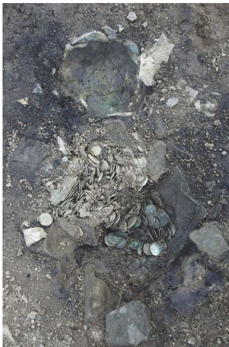
Fig. 1. Fyndplatsen med lerkärlen in situ.

trots att man även där hade ett system med typväxling och myntindragning. Det förefaller alltså som om myntcirkulationen i Skåneland var mer strängt reglerad vad gäller de lokala danska mynten.