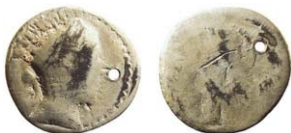
Fig. 4. Barbarisk efterprägling av en romersk denar. Som vanligt i gotländska fynd är den mycket sliten och den är dessutom försedd med ett hål. Det visar att den vid någon tidpunkt burits som ett smycke.

Myntningen i Tyskland skedde i regi av ett mycket stort antal myntherrar vid sidan