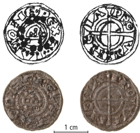
Grevskabet Provence og ærkebispedømmet Arles, penning (royal à la mitre), Arles, 1177-ca. 1185, præget på en raymondin. Ekonomiska Museet - Kungliga Myntkabinettet, Stockholm. Skala 1,5:1.

1868, s. 234-236). Denne kronologi er blevet generelt accepteret og optræder stadigt i standardværket om franske provinsmønter udgivet i 2004 (Duplessy 2004).