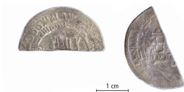
Kalifatet, Samanid, Ahmad b. Isma'il, dirhem, al-Shash, 913/4 e.Kr, fragment. Funnet på Greby handelsplats. Skala 1,5:1.