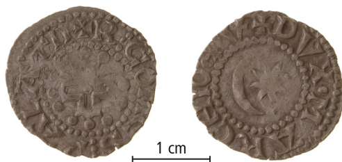
Markgrevs-kabet Provence, penning (raymondin), kort kors, 1. variant, ca. 1150-ca. 1185. Ekonomiska Museet - Kungliga Myntkabinettet, Stockholm. Skala 1,5:1.