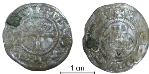
Normandie, Richard I (945-996), penning, Rouen. Från Viggbyholmskatten. Skala 1,5:1.

pen inte setts till, och vissa forskare trodde till och med att teckningen var felaktig och undrade om typen överhuvudtaget existerade. Men med det nyfunna exemplaret är det slutgiltigt bevisat att typen verkligen existerar. På mynten står det Richard, men det är inte specificerat om det är Richard I (946–996), II (996–1026) eller III (1026–1027). Utifrån Viggbyholmskattens datering kan man nu säga att det måste vara Richard I.