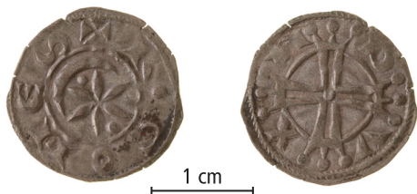
Markgrevs-kabet Provence, penning (raymondin), langt kors, ca. 1193-ca. 1250. Ekonomiska Museet - Kungliga Myntkabinettet, Stockholm. Skala 1,5:1.

fundene fra Vebron og Saint-Crépin. Den tidlige fase står ikke så tydeligt i skemaet over skattefund, men man fornemmer dog, at CC1/2 er tidligere end CL. Et problem er, at fundene fra slutningen af 1100-tallet er dateret ud fra nogle mønttyper, der blev præget i meget lang tid. Nogle skattene kan derfor være meget senere end det opgivne årstal.