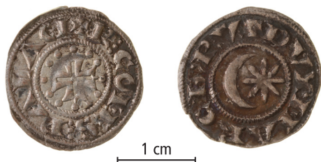
Markgrevs-kabet Provence, penning (raymondin), kort kors, 2. variant, ca. 1185-ca. 1193. Ekonomiska Museet - Kungliga Myntkabinettet, Stockholm. Skala 1,5:1.