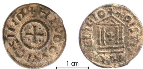
Frankerriket, Ludvig den Fromme (814–840), penning, obestämd myntort. Funnet på Greby handelsplats. Skala 1,5:1.