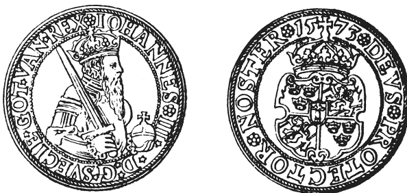
Fig. 1. Levins beskrivning över Johan III:s mynt ingår som en i raden av kataloger vid 1800-talets slut. Här återges ½ riksdaler 1573.

Olof Hallborg (1815-1901) och Robert Hartman (1827-1891) publicerade 1883 det första arbetet av corpuskaraktär över svenska mynt och det