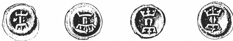
Fig. 4. Exempel på mynt av den grupp som präglades 1355-1363.

En jämförande kvantitativ metod har använts vid en analys av lösfynd och