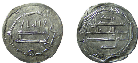
Fig. 4. Kalifatet. Abbasid, kalif Harun al-Rashid, Madinat Zaranj 192 e.H. (807/8 e.Kr.). Funnen i Häcklinge, Gästrikland.

tid över hela landskapet, men då ofta i gravar. De visar att mindre mängder mynt fanns att tillgå i hela landskapet. De två skatterna med västerländska mynt kommer också från Gävletrakten; en med okänt antal mynt och sannolikt från början av 1000-talet samt en för det svenska fastlandets del mycket sen, slutmynt 1083, med 13 ex. från Allmänninge, Valbo sn. Den är även intressant genom att den innehåller andra föremål i silver som smycken och ett krucifix. Mynten täcker flera hundra år och alla mynten har hål och/eller öglor.