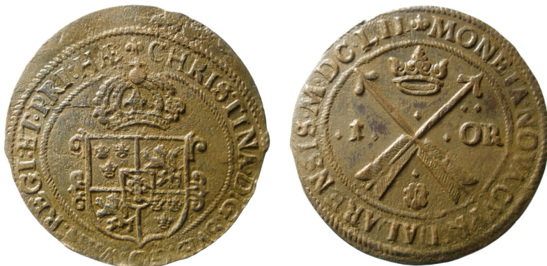
Fig. 5. Kristina, Avesta, 1 öre 1652. Funnen vid Norrhamn, Storjungfrun, Gästrikland.

Under 1500-1600-talen användes stora silvermynt, talrar, som internationella betalningsmedel. I Hälsingland har en tysk ½ taler 1614 från hertig Friedrich Ulrich av Braunschweig-Wolffenbüttel hittats. Till slutet av denna import får man räkna en spansk 2 reales 1707 (motsvarande 1/4 taler i värde) funnen i Gävle. Spanska mynt som var internationellt gångbara är synnerligen sällsynta i svenska fynd.