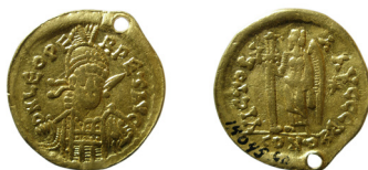
Fig. 3. Östromerska riket, kejsar Leo I 457-474, solidus. Funnen i Rångsta, Hälsningland.

Under folkvandringstiden importerades väst-och östromerska guldmynt, solidi. Vid nyodling 1910 hittades en solidus från Leo I 457-474 i Rångsta, Hedesunda sn, Gästrikland (fig. 3). Förutom solidusen ingick även tenar och ringar i guld med en sammanlagd vikt av 120 g. I Byn i samma socken har ett annat guldfynd med två spiraltenar med en vikt av 149 g gjorts. Värdevärdigt motsvarar det vikingatida skatter med en vikt på över ett kilo resp. 1,5 kilo. Fyndplatserna ligger nära Dalälven, som under forntiden var en viktig transportled. Fynden är två av de fyra största guldfynden i Norrland och vittnar om en rikedom som kan antas kopplas till järnhantering.