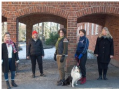
Bild 2) Barn- och ungdomsvetenskapliga institutionen med Centrum för barnkulturforskning, Frescati backe-husen.

Bild 1) Medarbetare på Centrum för barnkulturforskning i mars 2021: Margareta Aspán, Moa Wester, Ylva Lorentzon, Malena Janson och Manilla Ernst. Med på bilden är också Silva.