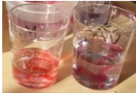
Bild 3: Alginatmaskar i en sur respektive en basisk lösning för att likna magsäck och tarmar.

Del II: Antocyaner är röda i sur miljö och blåa i basisk miljö. I laborationen används de för att indikera om det är surt eller basiskt omkring alginatmaskarna.