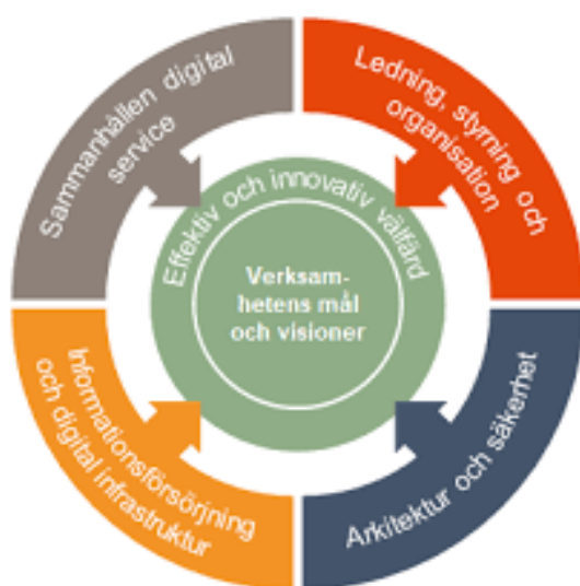
Figur 2 – Utveckling i en digital tid (SKR 2019d:3).