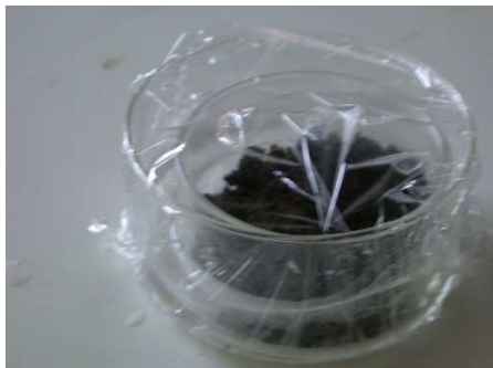
Figur 1: Försöksuppsättning med plastfolie

Vi andas syre och andas ut koldioxid. Vad gör bakterier?