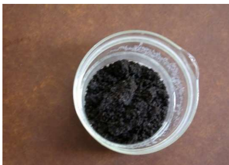
Figur 2: Vit kalciumkarbonat har fällts ut

Resultat: Kalkvattnet grumlas eftersom de flesta bakterierna bildar koldioxid. Koldioxid bildar fällning med kalkvattnet.